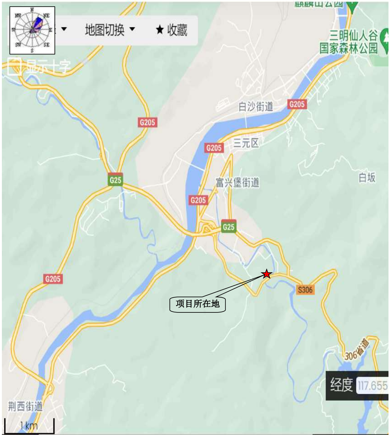
附图 1 项目地理位置图