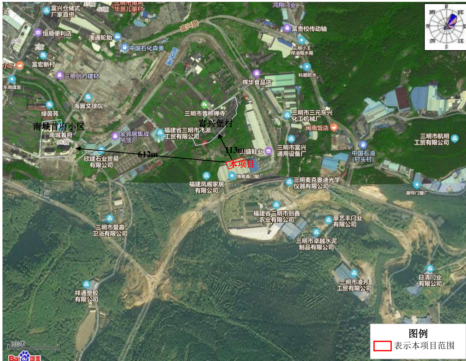
附图2 项目周围环境及保护目标示意图