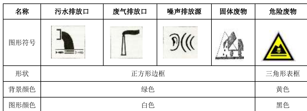
表4-21 各排污口（源）标志牌设置示意图